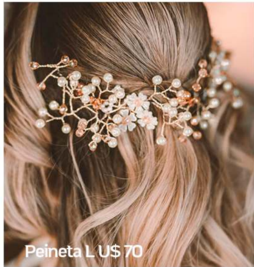
Peineta L U$ 70