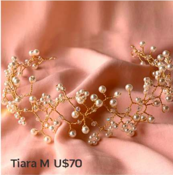
Tiara M U$70