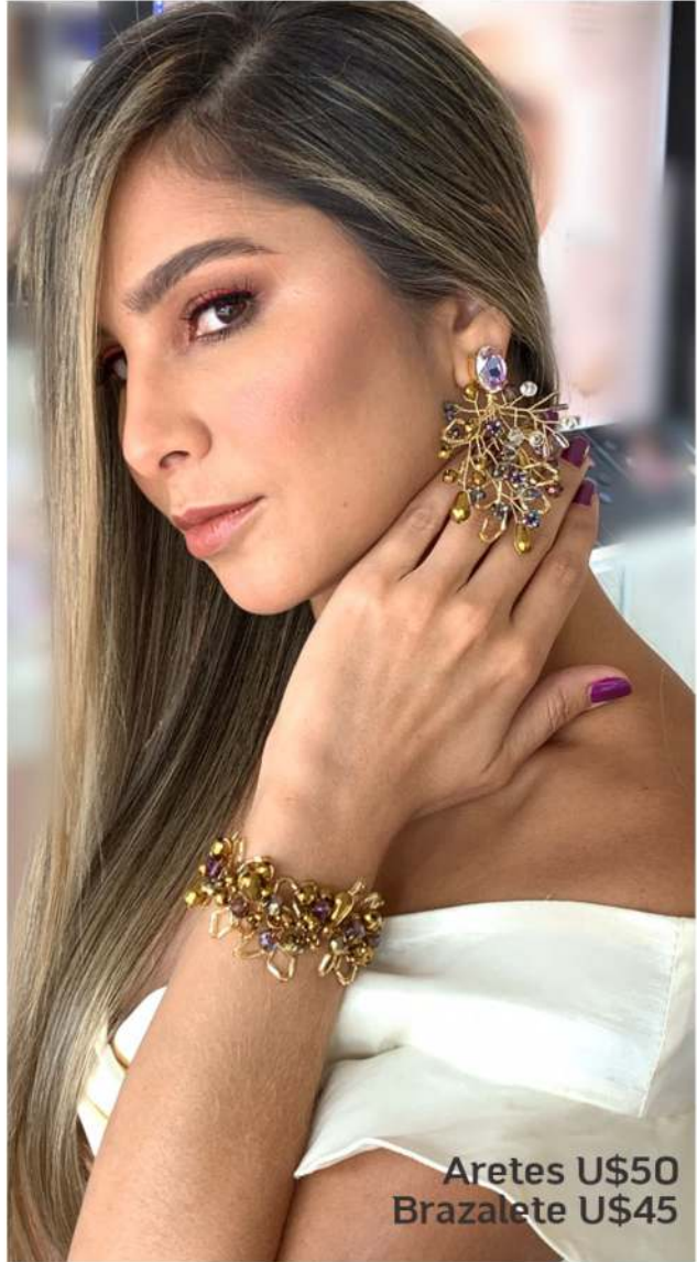
Aretes U$50 Brazalete U$45