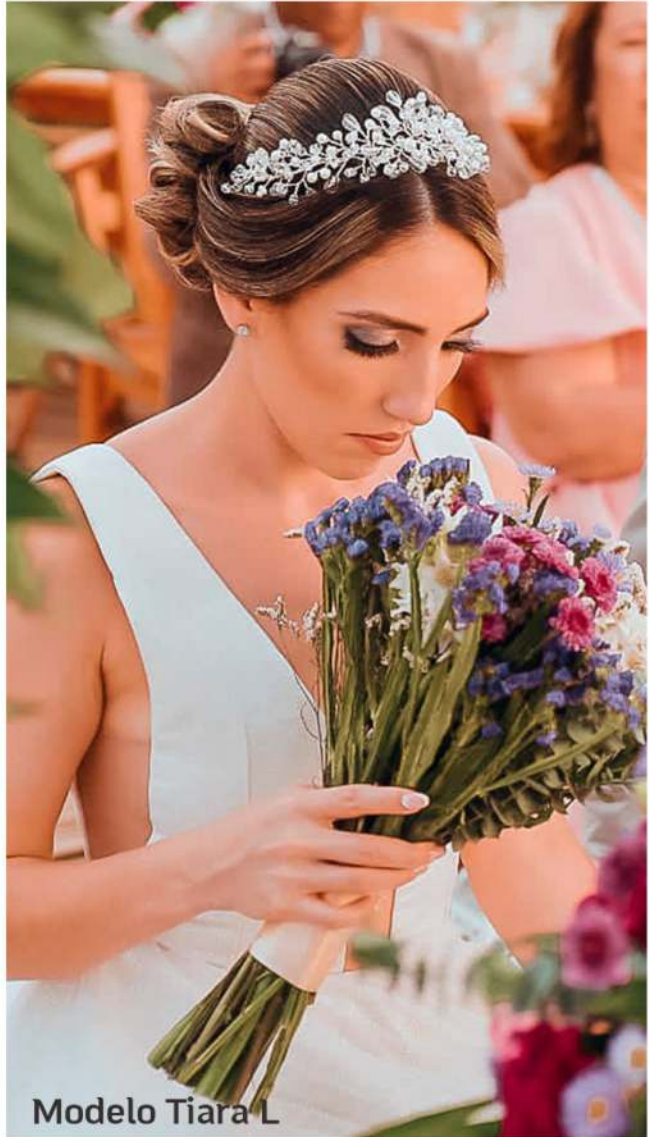
Modelo Tiara L