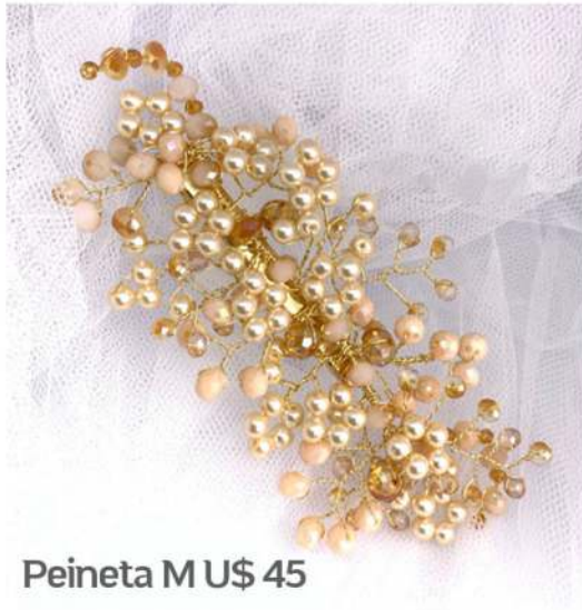
Peineta M U$ 45