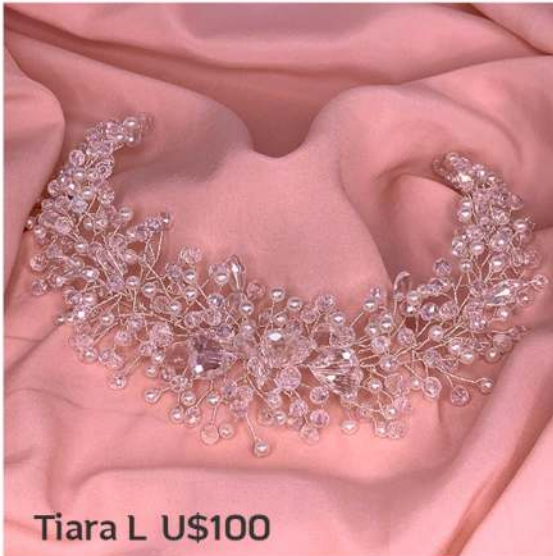
Tiara L U$100