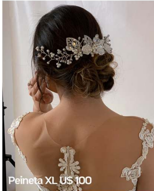
Peineta XL U$ 100