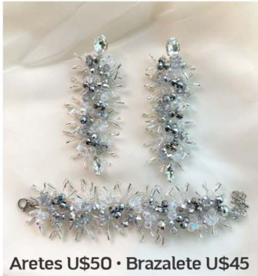
Aretes U$50 • Brazalete U$45