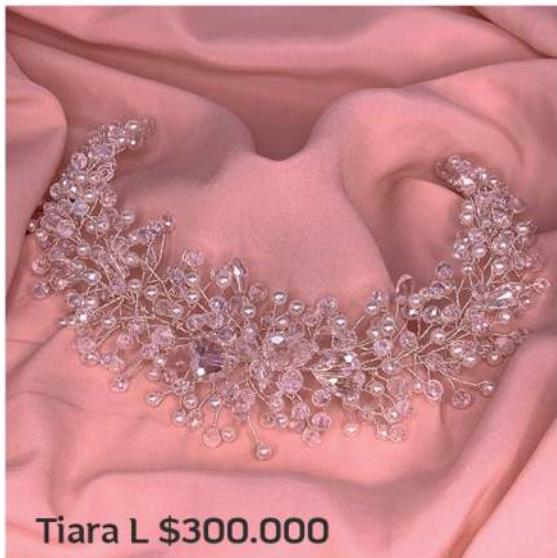
Tiara L $300.000