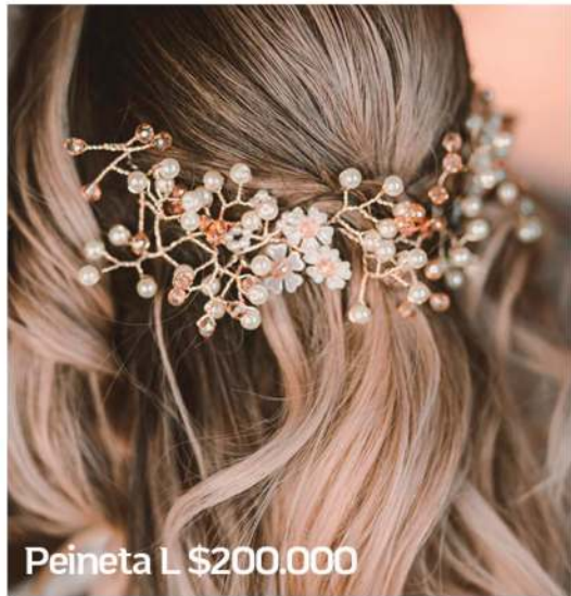
Peineta L $200.000