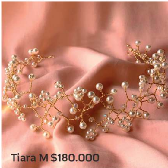
Tiara M $180.000