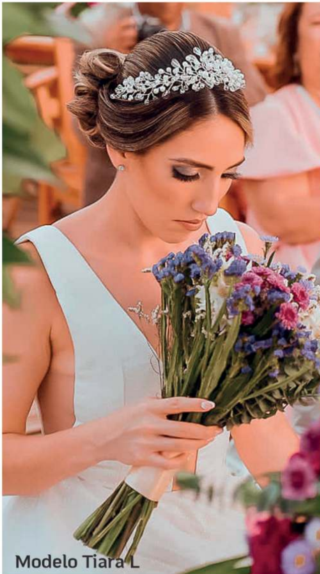
Modelo Tiara L